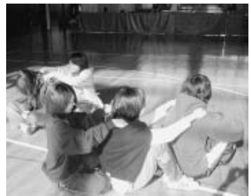
楽しそうなレクリエーションスポーツ

レクリエーションスポーツの活動は、講師の先生に指導していただき、高齢者や障害者と一緒に楽しくできる運動」を実践的に学んでいます。例えば、「幸せなら手をたたこう」でリズムに合わせて楽しく体を動かしたり、替え歌をして頭を使ったりしています。声を出すことはすごく大