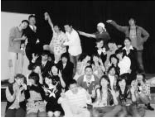
公演を終えて - 笑顔でパチリ -

があるのですが、一回目は学園祭、二回目は二月末の卒業公演です。普段の授業は、それに向けた台本作りやけいこです。直前になって、授業時間外にも集まって準備します。 あなたが、演劇を選んだ理由は？ 演劇は第二希望で入ったんですけど、劇をやるなんてことは、小学校の学芸会以来です。多くの人は、第六希望か第七希望ですよ。 演劇は希望が少ないですね。なぜでしょうかね。 人の前に出てしゃべるということに抵抗感を持つと思います。 実際やってみると面白いということと、二年生になると、みんな第一希望になっちゃってますよ。 演劇やって、自分が変わったなあと思うことは？