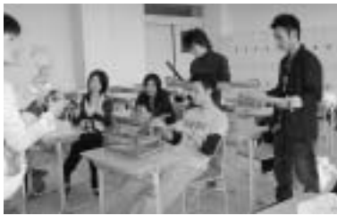
手作り楽器で演奏を楽しむ

手作りの楽器や歌のレパートリーを沢山持ち、音楽療法で勉強したことを現場で生かしたいですね