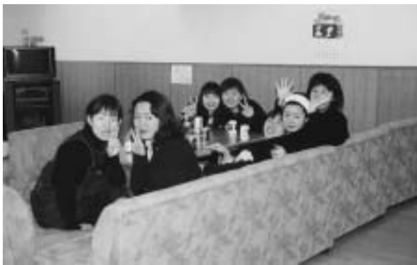
学生寮多目的ホールにて