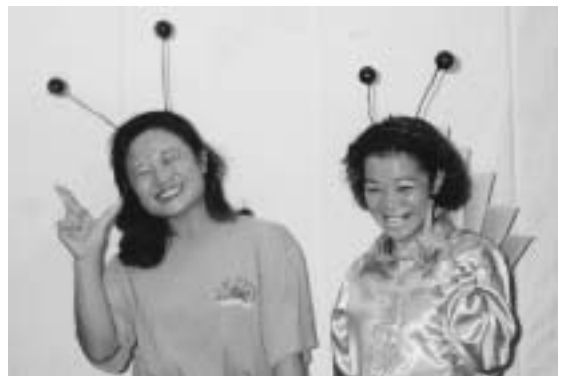
たつぷく祭「演劇」でのひとこま

がないために即戦力にならないのではないかという思いがあります。 実習期間中、寮母さんに助けられながらやってきたのだから不安はいっぱいです。でも笑顔でがんばっていききたい。